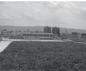
医療福祉施設屋上 (VUS500)